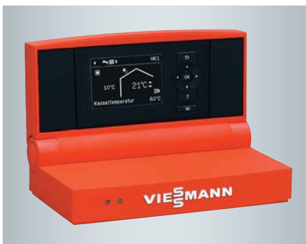
Vitotronic Regelung mit übersichtlicher Menüführung